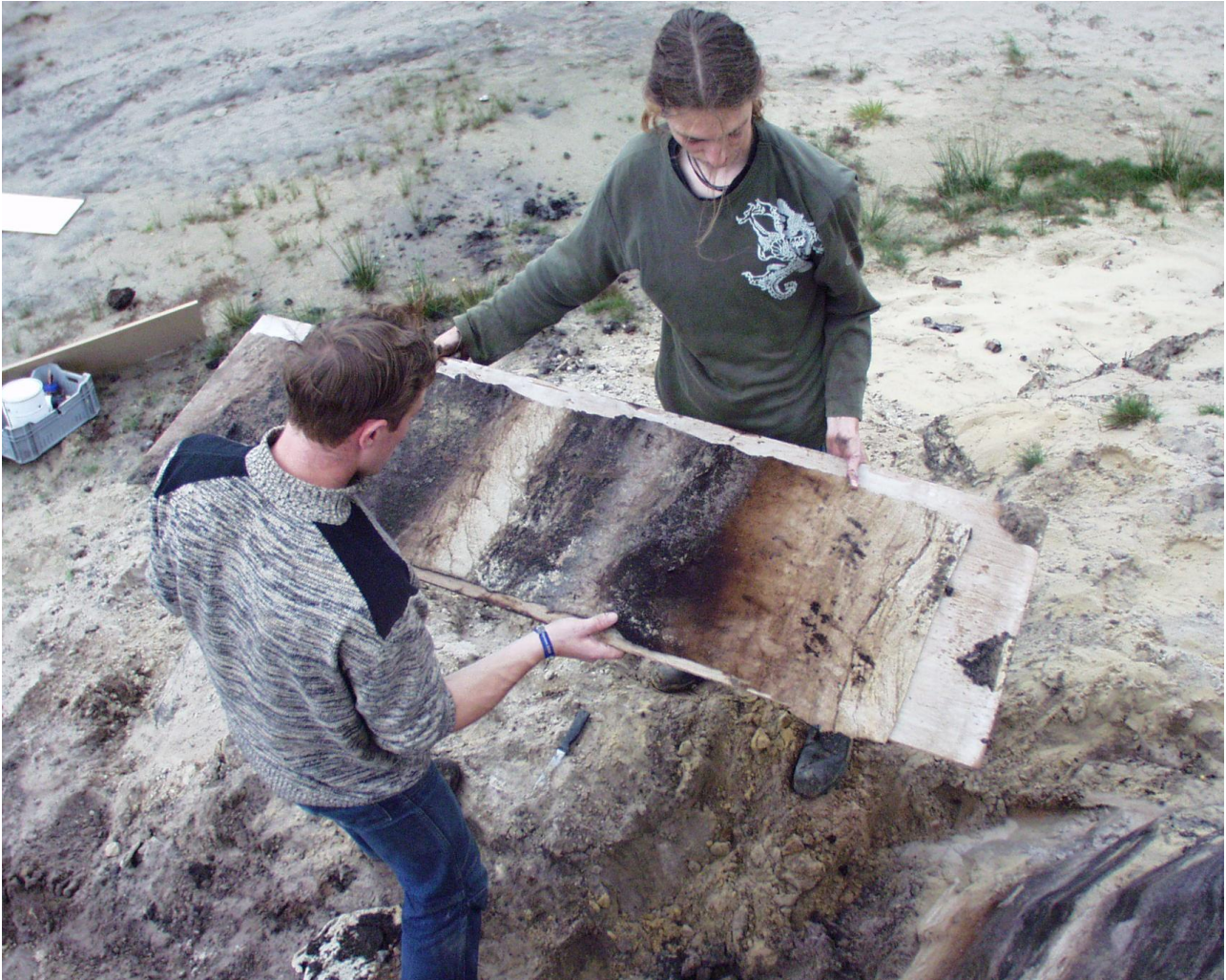
Studenten aan het werk in Groeve Boudewijn

Diverse pogingen om in de voormalige groeve een echt aardkundig monument te realiseren bleken niet haalbaar. Een idee van RO&AD (de ontwerpers van o.a. de Mozesbrug bij fort De Roovere) was zeker spectaculair, maar ook spectaculair duur. Achteraf ook maar beter want een spectaculaire toeloop van toeristen zou het gebied niet aan kunnen, het staat al zo onder druk.