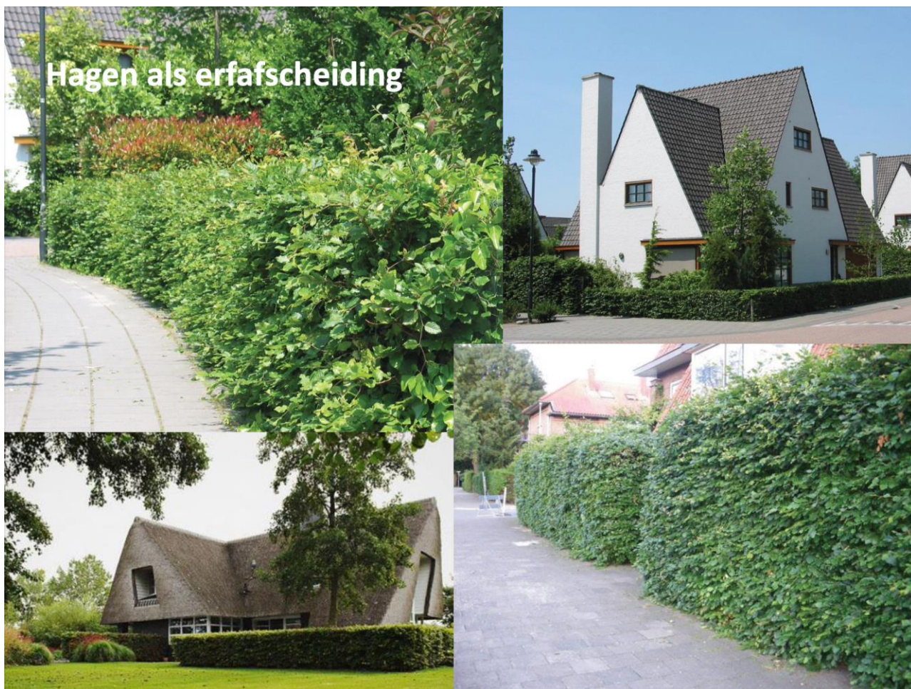
Presentatie 13 juli 2017 – voorbeelden van een goed idee

Bijna allemaal grote hekken met vaak wel wat groens (zelfs één met van die groen/zwarte plastic lappen), maar van ons idee 'mooie hagen als ideale snelweg voor plant en dier', is weinig terecht gekomen. We voelen ons eigenlijk wel een beetje gepiepeld.